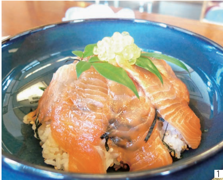
1.あまごのづけ丼 (1,200円) 2.雰囲気の良いお店です

伊豆市市山540-1 TEL/0558(85)2016 営業時間/11:00～15:00 定休日/水曜日 駐車場/あり