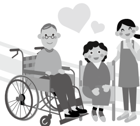
誰かの願いが叶う