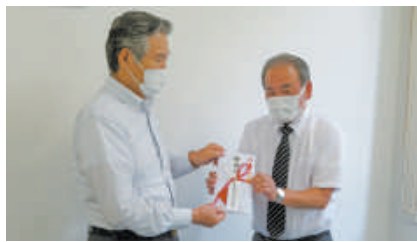
(株)ジェイエイ・メモリアルセンター