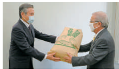
米 修善寺ライオンズクラブ